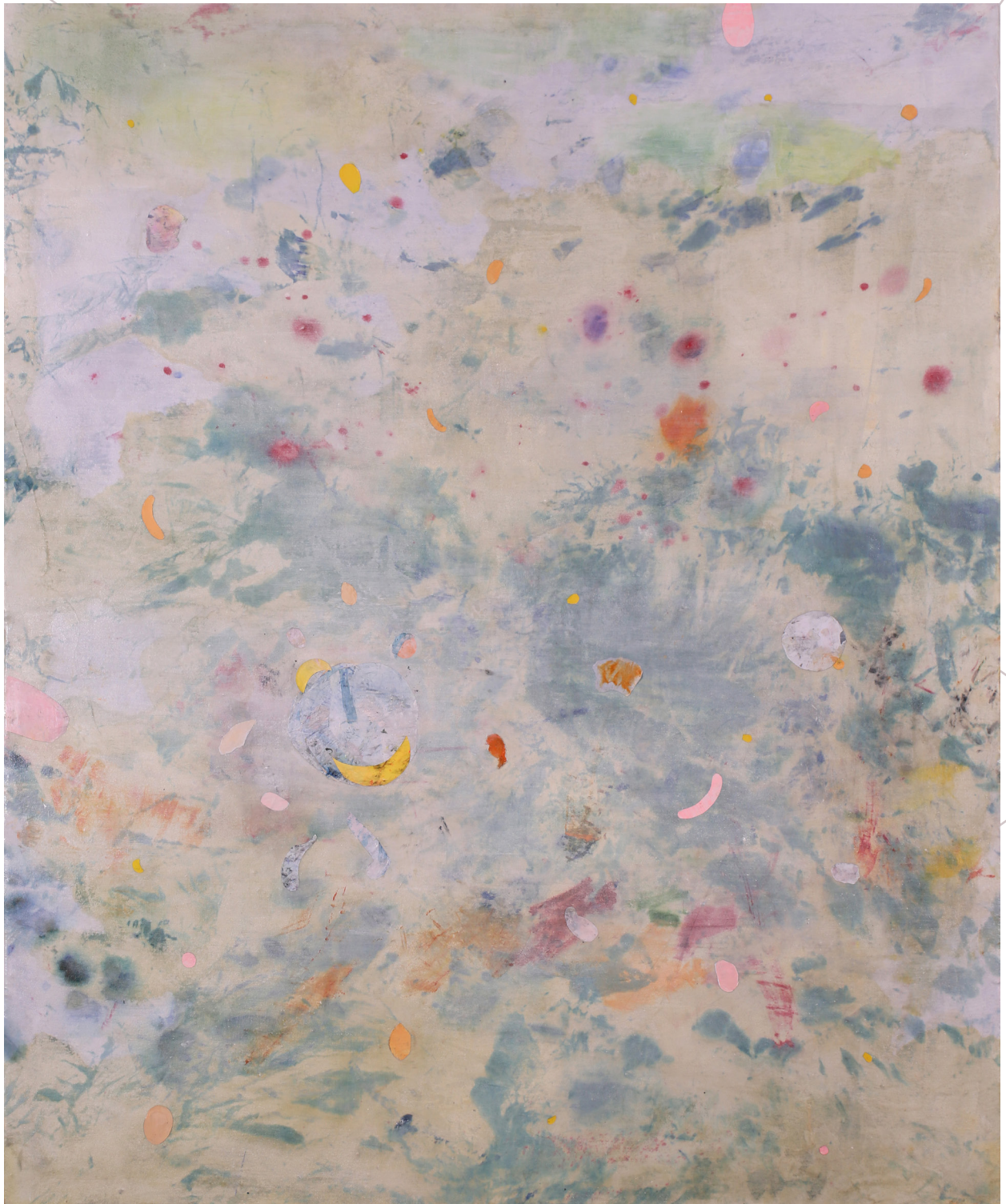
kosmologische Radierung 2013 Öl, Acryl, Papier und Silikon auf Bettlaken 139cm x 168cm