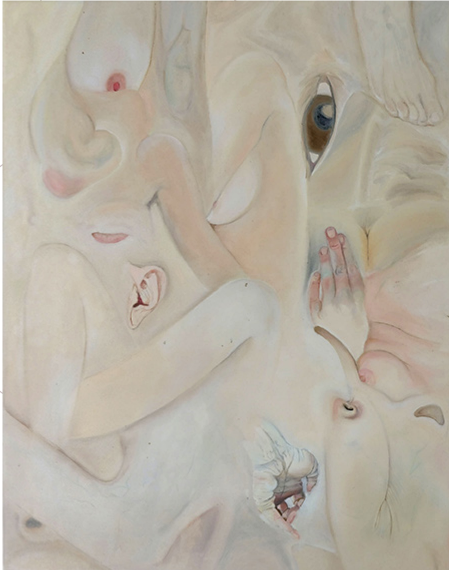
what I didn't want to tell you 2020 Öl auf Leinwand 100cmx80cm