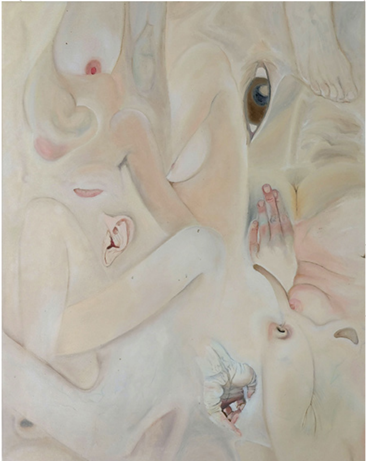
what I didn't want to tell you 2020 Öl auf Leinwand 100cmx80cm