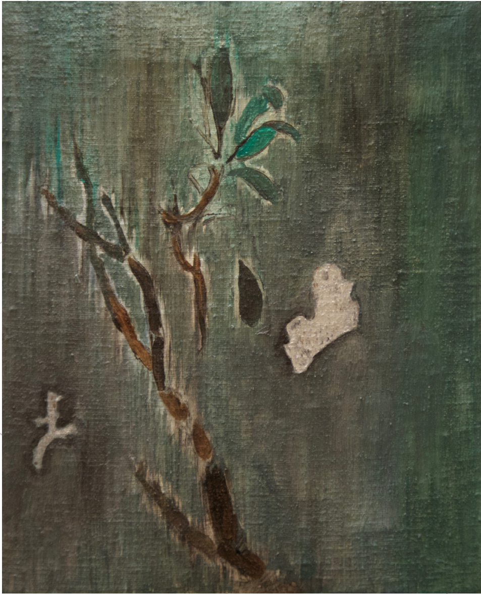
an einem anderen Tag oder wo ich noch gewesen bin 2018 Öl und Acryl auf Leinwand 20cm x 24cm