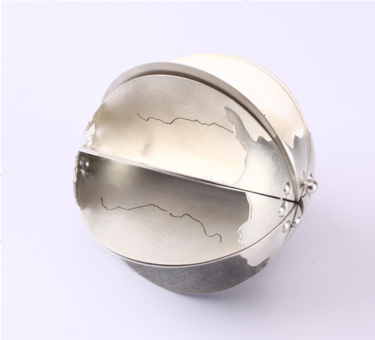
PANGÄA PUNKT 7 2020 925er Silber 8cm x 8 cm