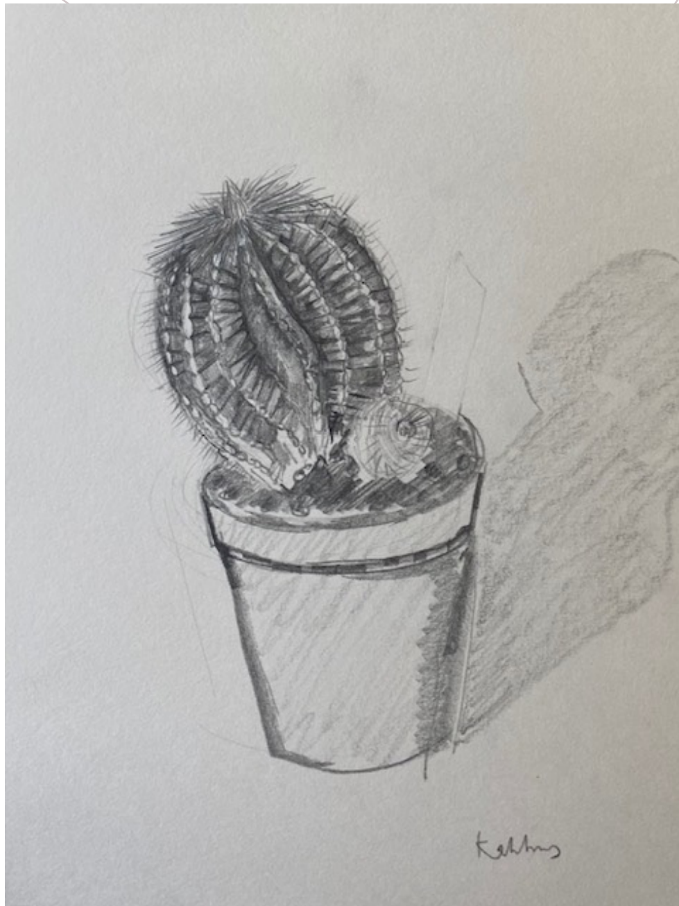
Studien über meine Zimmerpflanzen Bleistift auf Papier 15 cm x 10 cm 2018