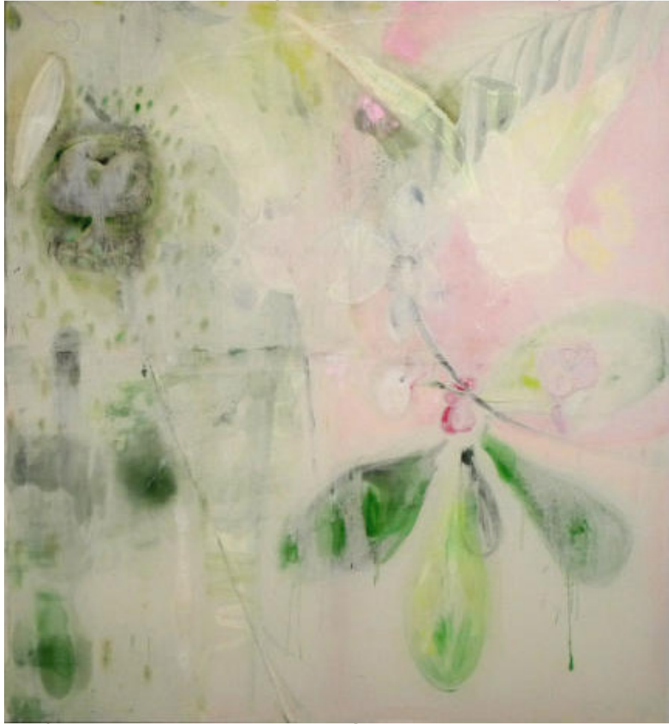
Nature 2014 Öl, Acryl, Papier und Bleistift auf Baumwolle 168cm x 175cm