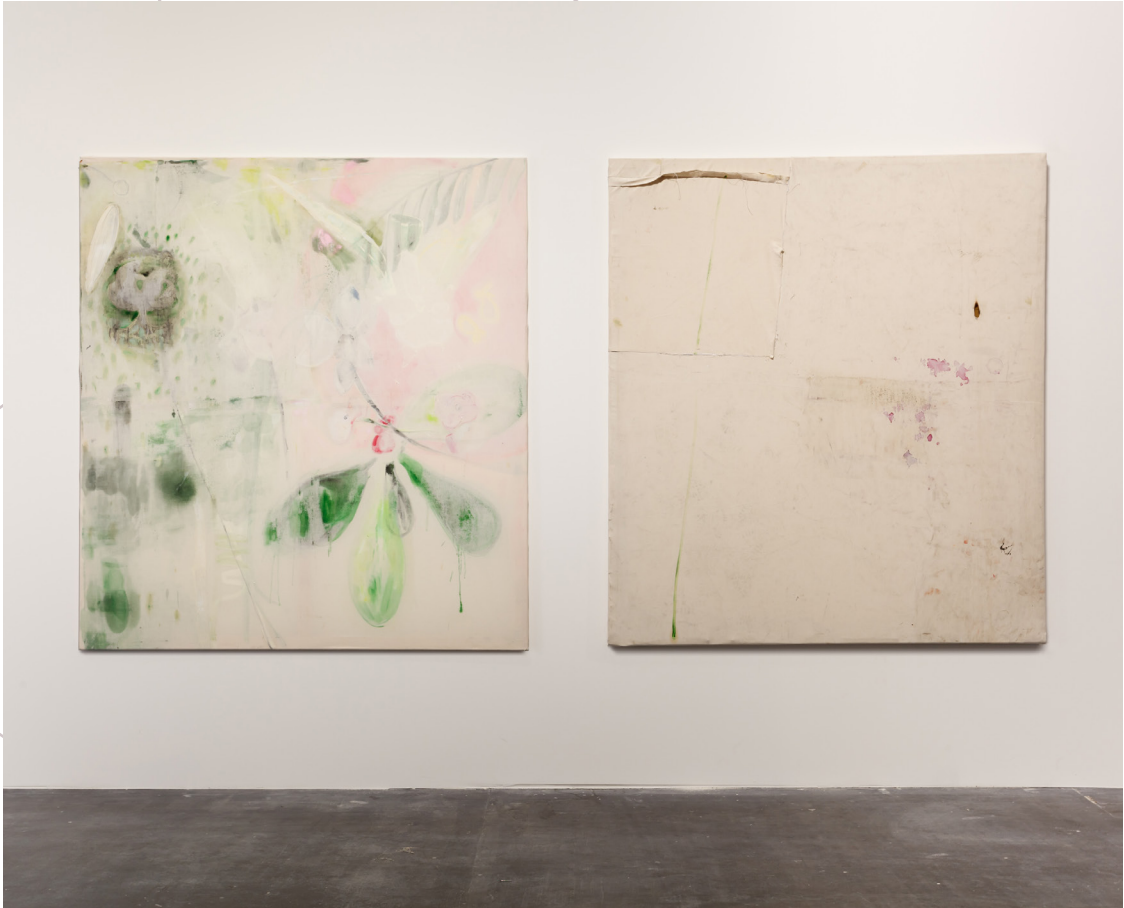
Ausstellungsansicht , MMK Abschlussausstellung Pashmina, Städelschule (Jahrgang 2014)