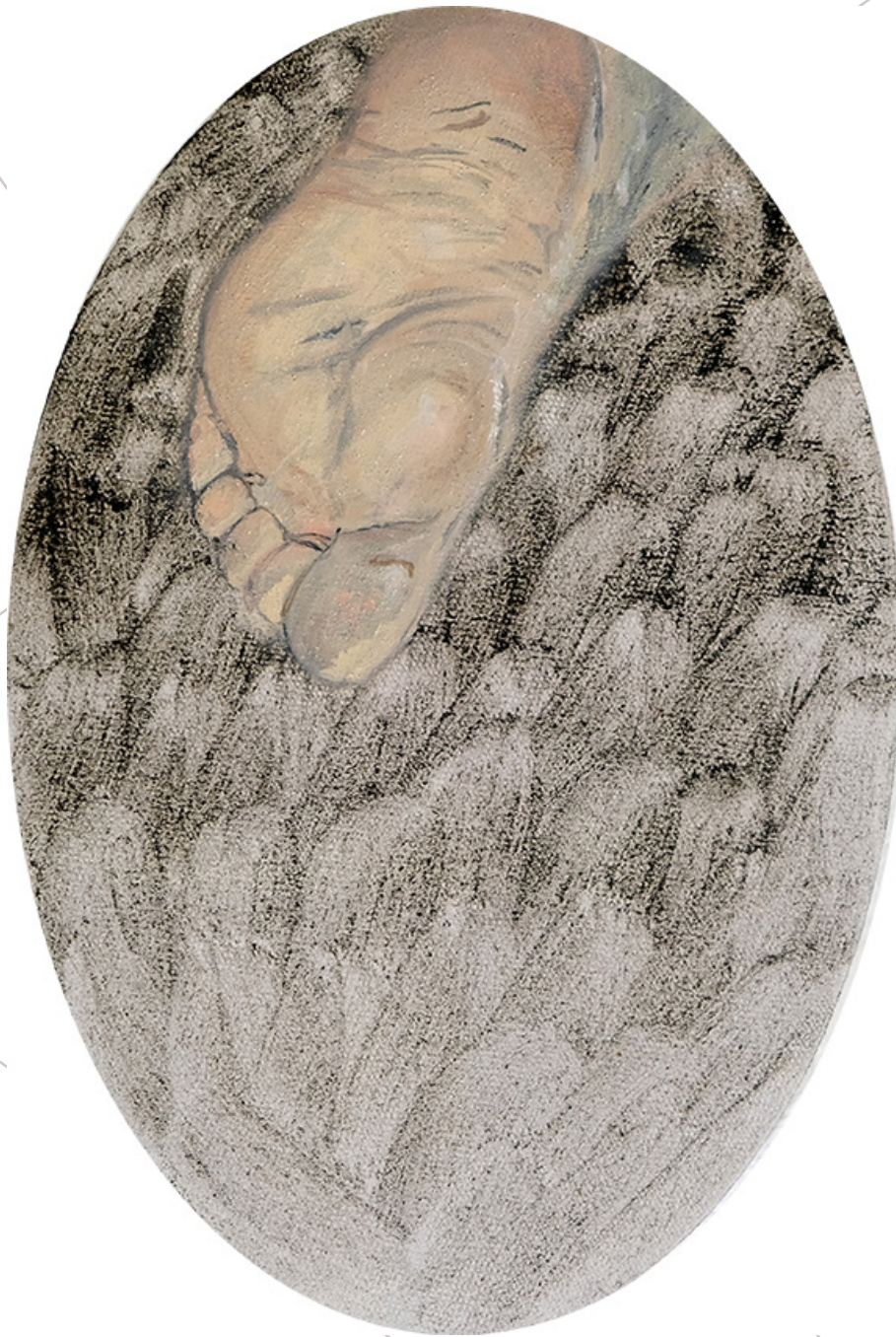
the wings of Hermes as a pillow 2020 hergestellte Pigmente (Ätnagestein) und Öl auf Leinwand 20cmx30cm